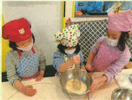
たまごひとつ、ぎゅうにゅう150cc