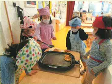
裏返して両面焼けたら出来上がり。