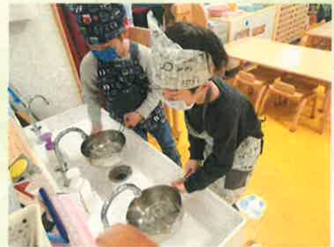
お湯を沸かそう!!! ラーメン作り。