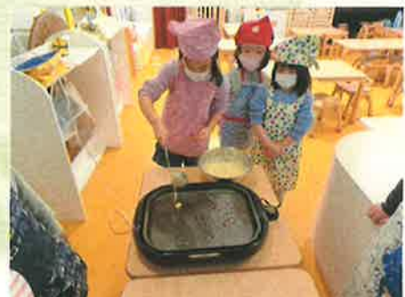
「油は、わたしがやるね。」 とすすすいくみ。