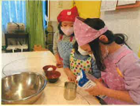
今日は、ホットケーキとらーめんをつくりました。