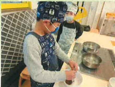
スープをどんぶりにいれて、スープづくり。