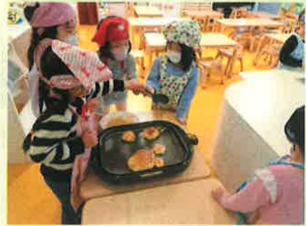
3ふんとは？ 「え〜と 60がさんかいだ」 「・・・180だ」