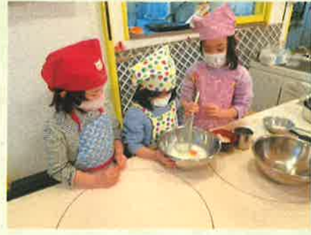
作り方の表を見ながら早速調理開始