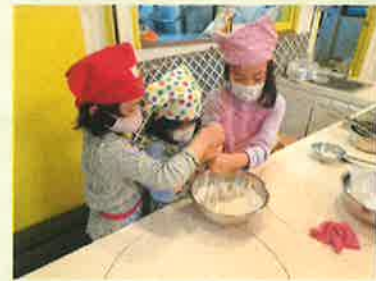
よくかきまぜます。 みんなで協力です。ホットケーキミックスをいれたら、50～60回かきまぜます。みんな、1, 2, 3, 4・・・と数えています。