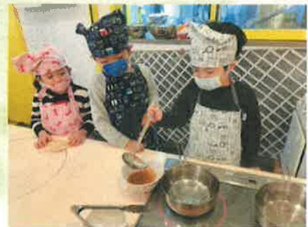
お湯を気を付けよう。