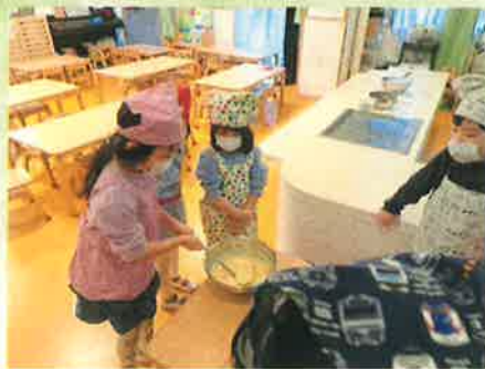
ホットプレートでつくろう。