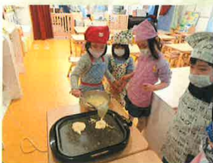
少し、高い所から垂らすのがポイント。