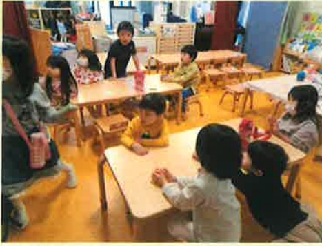
「ホットケーキにシロップかったよ!!!」